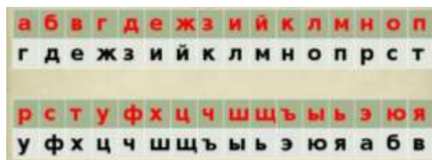
Рис. 2. Код Цезаря

Приложение: первый ряд зашифрованное, второй рабочий шифр (Рисунок 2).