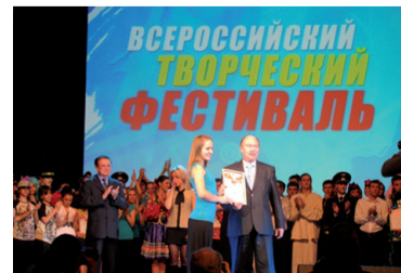
Всероссийский творческий фестиваль транспортных вузов «ТрансАрт-2012» 10.12.2012 г.