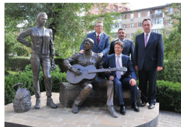
Министр транспорта РФ М.Ю. Соколов посетил РГУПС 10.09.2012 г.