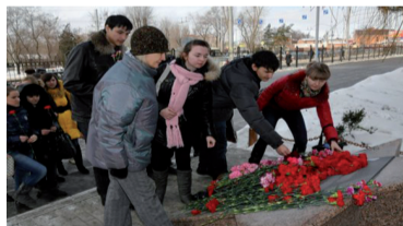
Возложение цветов в День освобождения Ростова-на-Дону от фашистских захватчиков 15.02.2012 г.