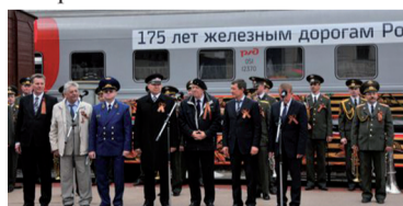
Ретро-поезд «Победа» 24.04.2012 г.