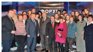
Молодежный форум в студии ГТРК «Дон-ТР» 26.01.2012 г.