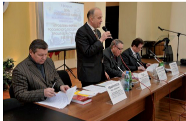
День науки 09.02.2012 г.