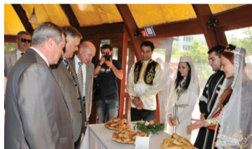
Праздник День семьи 16.05.2012 г.