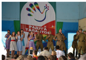
Народный вокальный ансамбль «Успех» в благотворительной акции «Молодежь Дона за общую историческую память» 03.08.2012 г.