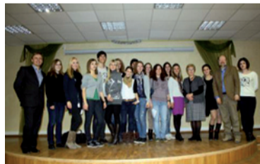
Визит делегации гимназистов из Германии в РГУПС 10.04.2012 г.