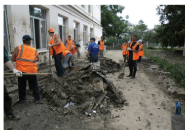
Оказание помощи жителям Крымска, пострадавшим от наводнения 12.07.2012 г.