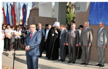
Открытие филиала Центра национальной славы России 16.05.2012 г.