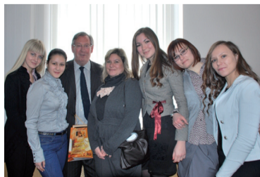
Визит делегации г. Ле-Мана (Франция) в РГУПС 28.02.2012 г.