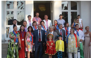
Празднование Дня русской культуры в Анталии (Турция) 22.06.2012 г.