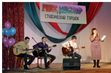
Конкурс «Мисс и мистер студенческий городок» 04.04.2012 г.