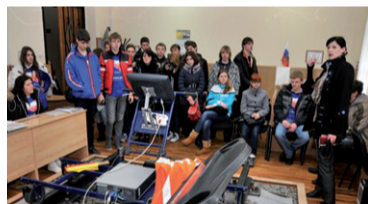
День открытых дверей компании ОАО «РЖД» в РГУПС 29.03.2012