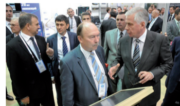
Шестая Международная научно-практическая конференция «Транс-Жат-2012» 05.10.2012 г.