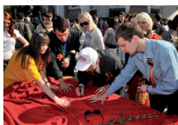
Мероприятия в честь Дня Победы 10.05.2012 г.