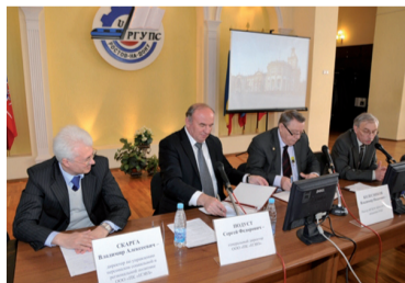
Подписание договора о сотрудничестве с ПК «НЭВЗ» 22.02.2012 г.