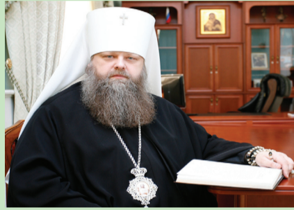
ДОРОГИЕ ПЕДАГОГИ, ВОСПИТАТЕЛИ! УЧАЩИЕ И УЧАЩИЕСЯ! УВАЖАЕМЫЕ РОДИТЕЛИ!

Примите мои поздравления с началом нового учебного года.