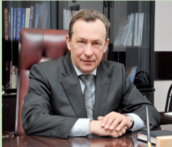
УВАЖАЕМЫЕ ПЕРВОКУРСНИКИ! УВАЖАЕМЫЕ ПЕДАГОГИ, СТУДЕНТЫ И СОТРУДНИКИ!

От всей души поздравляю вас с Днем знаний и началом нового учебного года!