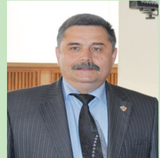
УВАЖАЕМЫЕ ПРЕПОДАВАТЕЛИ, СОТРУДНИКИ И СТУДЕНТЫ!

МЕРКУРИЙ, Митрополит Ростовский и Новочеркасский