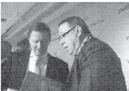
На фото: С.Б. Иванов, вице-премьер РФ и ректор РГУПС, академик РАН В.И. Колесников

Результатами работы форума стали подписание договора между железнодорожными компаниями ОАО «Федеральная пассажирская компания» и «SNCF» о курсировании международного пассажирского поезда Москва - Берлин - Париж, а также подписание соглашения о сотрудничестве