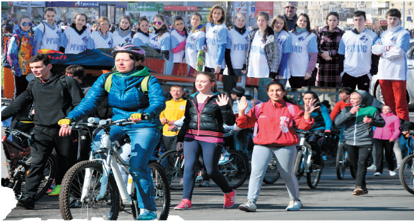
5 апреля 2014 г. студенты РГУПС приняли участие в общегородском массовом мемориальном пробеге «Ростовское кольцо», посвященном 69-й годовщине Победы в Великой Отечественной войне