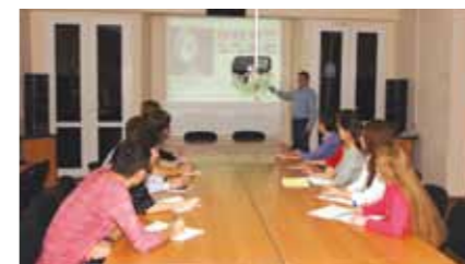
Занятия в мультимедийном компьютерном классе заочного факультета

привязан к определенному зданию, городу, где проходят лекции очников. Он может проживать и работать вдали от вуза, не тратя ежедневно драгоценные часы на дорогу. А для большей доступности высшего образования в нашем университете имеются филиалы в городах Минеральные Воды, Туапсе и Воронеже.