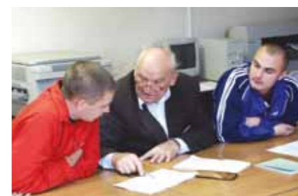
Консультации с заочниками проводят опытные сотрудники университета

Не стоит забывать, что заочное обучение дешевле очного и гарантирует при этом полноценное высшее образование.